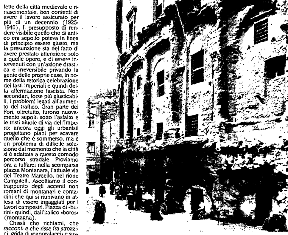
Le botteghe e i magazzini inseriti nel Teatro Marcello, prima degli scavi degli anni Trenta, in una foto. In alto a destra un'incisione della scomparsa piazza Montanara